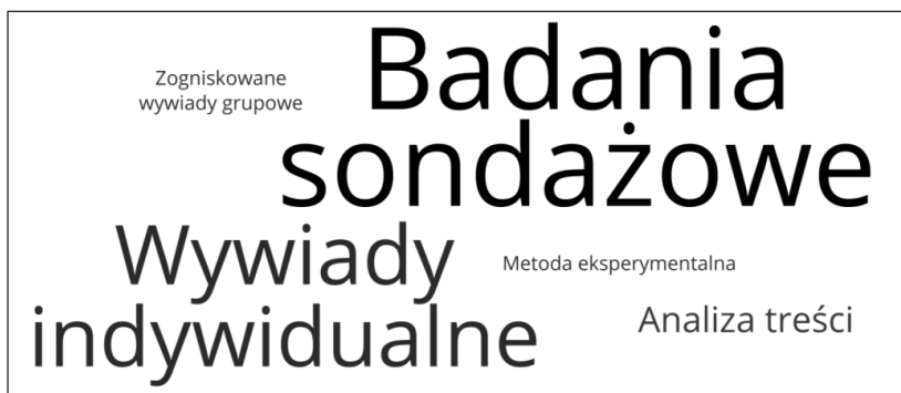
Rysunek 3. Frekwencyjność kategorii wykorzystywanych w badaniach przygotowania do i przechodzenia na emeryturę

Badacze we włączonych do przeglądu badaniach wykorzystywali różne strategie zbierania danych. W przeglądzie uwzględniono opracowania, w których wykorzystane zostały metody badań jakościowych, ilościowych oraz mieszanych.